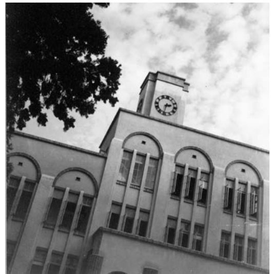
東京高等農林学校（農学部の前身）本館 （1940年頃 東京都府中市）