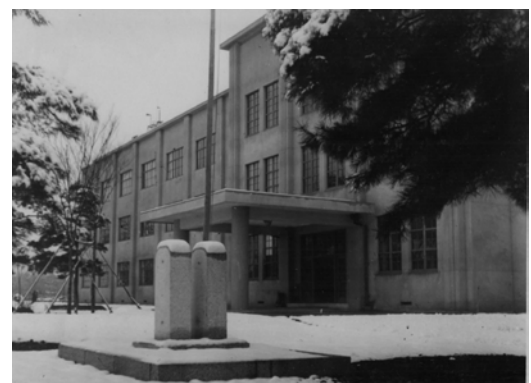
東京高等蚕糸学校（工学部の前身） 本館（1940年頃 東京都小金井市）